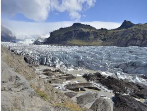
Svinafellsjökull, lingua glaciale di Vatnajökull

Soprannominato il “rifugio degli dei”, Asbyrgi è un canyon a nord dell’isola. Le rocce che lo delimitano sono alte circa 10 metri e hanno una forma molto particolare, simile a un immenso ferro di cavallo. Da qui nasce la leggenda sulla sua creazione: si racconta che a formarlo fu uno degli otto zoccoli del cavallo di Odino, conosciuto come Sleipnir, “colui che scivola veloce”. Un altro mito racconta invece perché Asbyrgi sia chiamato il “rifugio degli dei”: quando il popolo islandese tradì gli dei, gettando gli oggetti sacri nella cascata di Godafoss, questi decisero di non abbandonare del tutto l’isola ma si rifugiarono nel canyon protetto per continuare a vegliare.