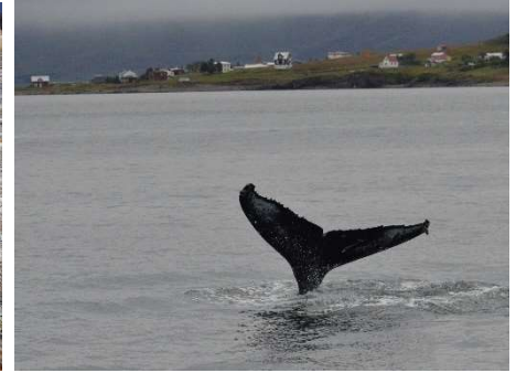
Balene a Husavik