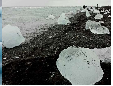
Spiaggia dei diamanti