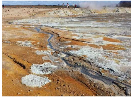
Hverir vicino Námaskarð