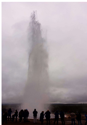
Geysir – Strokkur

si ammira l'enorme spaccatura fra i due continenti nordamericano ed europeo. Successivamente l'itinerario porta alla scoperta della fantastica cascata d'Oro, Gullfoss, e la zona delle sorgenti eruttanti di Geysir. Pranzo libero. Si prosegue verso le pianure meridionali. In costa sud si ammirano due belle cascate, Seljalandsfoss e Skógafoss. Sosta nella zona del santuario degli uccelli marini di Dyrhólaey. Magnifici panorami della costa, dei ghiacciai interni e delle spiagge sull'oceano Atlantico. Sistemazione in hotel e cena e pernottamento.