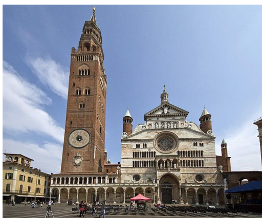
Cremona – Duomo