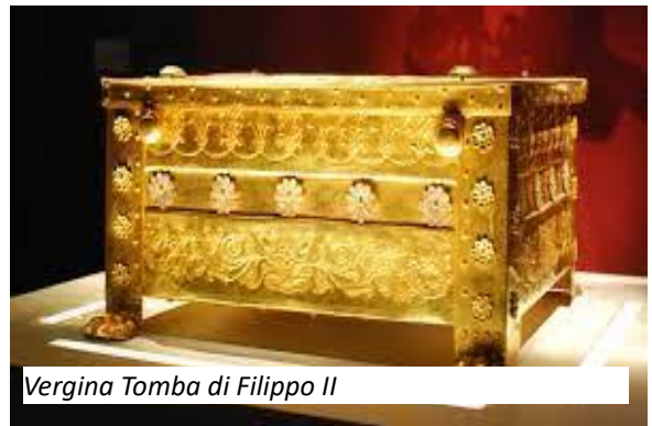
Vergina Tomba di Filippo II

Trattamento di pensione completa. Visita del museo della Cultura Bizantina che mira a illustrare i vari aspetti della vita durante il periodo bizantino e post-bizantino: l’arte, l’ideologia, l’organizzazione sociale, la religione, e l’impatto degli sviluppi storici e della situazione politica sulla vita quotidiana delle persone. Partiamo per Vergina dove faremo un salto nella storia entrando in un “tumulus” e dove ci ritroviamo in un vero e proprio museo, nel quale spicca l’imponente tomba di Filippo II, sepolto con scudo, faretra e armatura. Proseguiamo per Karditsa, sostando prima a Berea (l’attuale Veria) dove ricordiamo la storia di Paolo che, fuggito nella notte da Salonicco a causa dell’ostilità della comunità giudaica, arriva in questo villaggio e incontra giudei disposti ad accogliere la Parola con grande entusiasmo. Infine cena e pernottamento a Kalambaka.