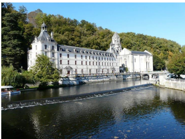
CATTEDRALE DI BRANTOME

Prima colazione in hotel e partenza per Bergerac; dopo breve passeggiata per la città proseguimento per Brantome con visita all'Abbazia. Pranzo libero. Nel pomeriggio visita di Perigueux, capitale del PERIGORD. Duemila anni di storia sono l'origine di un complesso unico nel Périgord: Perigueux la Cité Medievale Rinascimentale, una delle più vaste della Francia, con la Cattedrale Saint-Front iscritta al Patrimonio Mondiale dell'UNESCO e tappa sul cammino per Santiago de Compostela. Cena e pernottamento in hotel a Perigueux