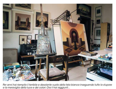
Ambiente 3183 1992, cm 80x80, olio su tela